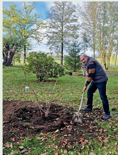
Auch Bürgermeister Falk Lindenau war aktiv an der Baumpflanzaktion beteiligt.